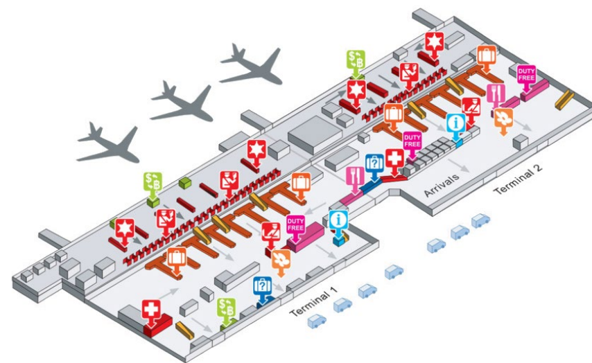
Рис. 4. План аэропорта Донмыанг