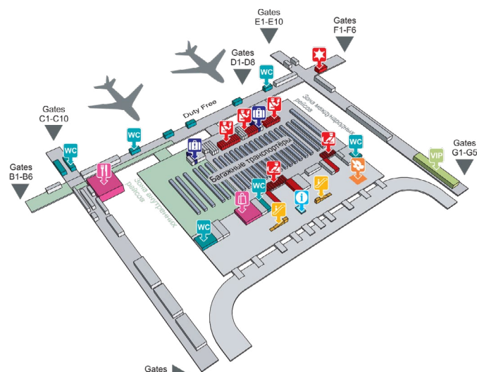
Рис. 3. План аэропорта Суварнабхуми

Туристов, прилетевших в аэропорт Донмыанг, встречают после получения багажа: пассажиров международных рейсов — на выходах 3 и 4 из здания аэропорта, внутренних рейсов — сразу по выходу из зоны багажных лент (рис. 4).