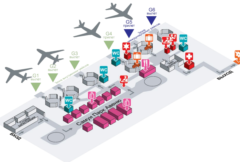
Рис. 7. План аэропорта Самуи

Туристов ждут в зоне, обозначенной как Meeting Point. Она находится в самом конце аллеи, по которой туристы выходят из секции получения багажа (рис. 7).