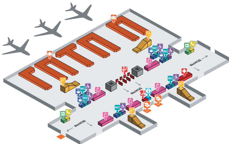
Рис. 5. План аэропорта Пхукета (International Terminal)

Туристов SAYAMA Travel встречают после получения багажа на выходе из здания аэропорта: пассажиров международных рейсов — на выходах 3 и 4 (рис. 5), внутренних рейсов — на выходе 1 (рис. 6).