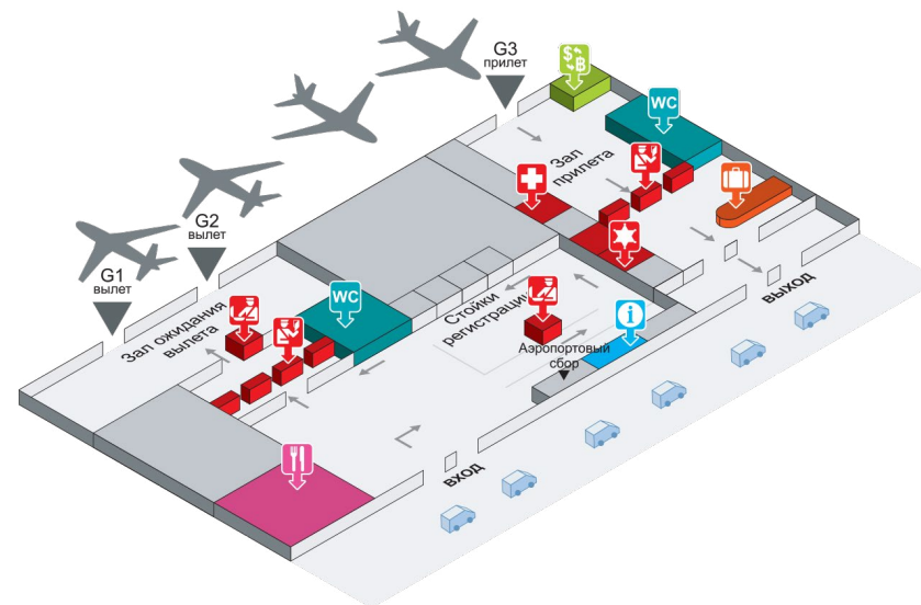
Рис. 9. План аэропорта Паттайи

Аэропорт Паттайи — У-Тапао — благодаря своим размерам также не оставляет возможности заблудиться или потеряться. Туристов встречают сразу за секцией получения багажа (рис. 9).